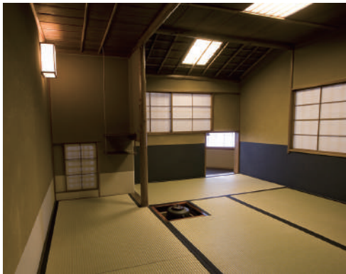
一与庵(三畳半台目)