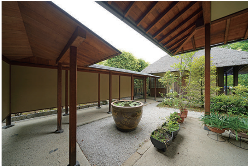
扁額・建仁寺 素堂老師 設計・杉山隆建築設計事務所 施工・水澤工務店

水澤工務店さんに施工してもらったお茶室、 全ての面で気に入っています。 品格・信頼・安心、あらゆる点で素晴らしく、 心から満足しています。