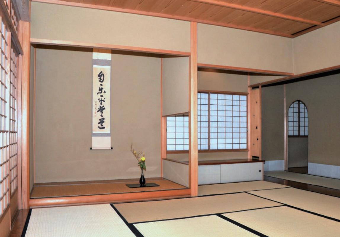
仙乗庵 鵬雲斎大宗匠 命名

「隠れ里 車屋」は、総理大臣をはじめ多くの芸術家や文化人に愛された車屋の秘蔵店。自然と静けさに囲まれた3500坪の広大な敷地にひろがるのは、最上級のおもてなし空間。移ろいゆく四季折々の美、絵画のような日本庭園、その中で供される至高の料理を心ゆくまで堪能してください。